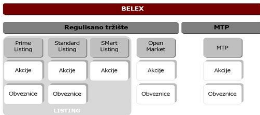
Слика 1. Организација тржишта Београдске берзе